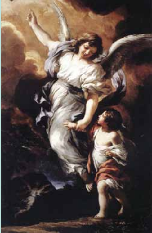
The Guardian Angel - 1656 by artist Pietro da Cortona

‘നിന്റെ കാവൽമാലാവയെ നീ ബഹുമാനിക്കുക. മാലാവയുടെ സംരക്ഷണത്തിന് നീ കൃതജ്ഞനായിരിക്കുക; മാലാവയിൽ ശരണപ്പെടുക, മാലാവയെ സ്നേഹിക്കുക, എല്ലാ വിഷമങ്ങളിലും വിപത്തുകളിലും പ്രലോഭനങ്ങളിലും മാലാവയിലേക്കു തിരിഞ്ഞ് അപേക്ഷിക്കുക.’ (വി.ബെർണാർദ്)