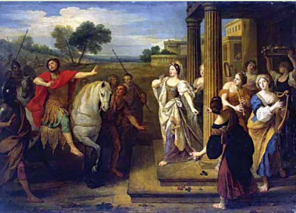
"Jephtha's Daughter" by artist Boulogne

നിശ്ചയത്തോടെ മറുതലിക്കുവാൻ നിവൃത്തിയില്ലല്ലോ. വിശുദ്ധി, ബുദ്ധി, പക്ഷത, സൗന്ദര്യം, ഇവയെല്ലാം കൂടിച്ചേർന്ന ഒരു മകളെയോർത്ത് ഏതൊരു പിതാവാണ് അഭിമാനിക്കാതിരിക്കുന്നത്? വില തീരാത്ത ഒരു നിധിയെ നൽകിയ അനന്ത കാരണമുണ്ടാകുന്നതോർത്ത് ആയിരം സ്തുതികൾ അർപ്പിച്ചി