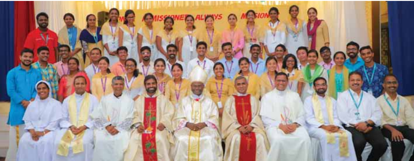
ഫുൾടൈമേഴ്സ്: ഇരുപത്തിയേഴാമത് ബാച്ച് ഫുൾടൈമേഴ്സിന്റെ കമ്മീഷനിംഗ് ചടങ്ങുകൾ ആലുവ ആത്മദർശനിൽ വച്ച് നടന്നു. പുനലൂർ രൂപതാധ്യക്ഷൻ റെറ്റ്. റവ. ഡോ. സിൽവസ്റ്റർ പൊന്നുമുത്തൻ പിതാവ് പുതിയ ബാച്ചിലെ ഇരുപത്തിയൊൻപത് പേരെയും പ്രാർഥിച്ചുനൂഗ്രഹിച്ച് പ്രേഷിത വയലിലേക്കയച്ചു.