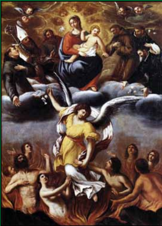
Painting: An Angel Frees the Souls of Purgatory Artist: Ludovico Carracci (1555–1619)

(വിശുദ്ധ ജർത്രുദിന്റെ പ്രാർഥന; നമ്മുടെ കർത്താവ് ഈശോമിശിഹാ വിശുദ്ധ ജർത്രുദിനോട് പറഞ്ഞു; ഈ പ്രാർഥന ഓരോ പ്രാവശ്യം ചൊല്ലുമ്പോഴും ആയിരം ആത്മാക്കൾ ശുദ്ധീകരണസ്ഥലത്തു നിന്നും മോചിതരാകുന്നുവെന്ന്. ആകയാൽ നമുക്ക് ഹൃദിസ്ഥമാക്കി ആവർത്തിക്കാം.)