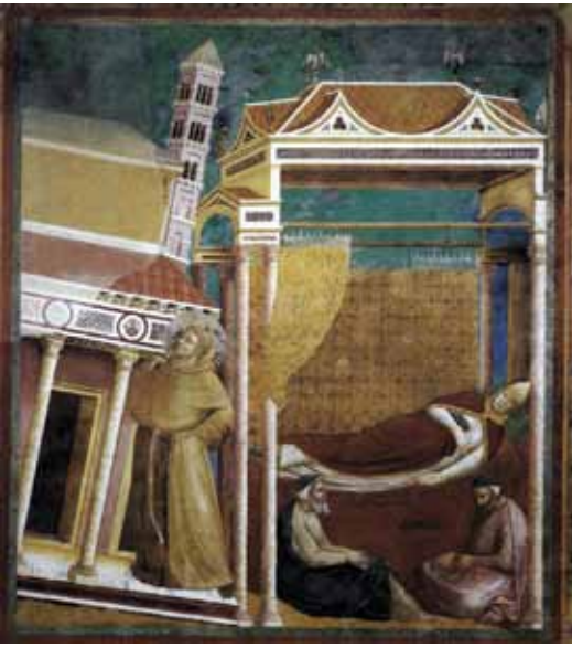
Painting: "The Dream of Innocent III" 1297-1299 by Artist Giotto

തന്നെക്കുറിച്ചുള്ള ദൈവത്തിന്റെ വഴികൾ വ്യത്യസ്തമാണെന്ന് അവൻ തിരിച്ചറിഞ്ഞു. പിന്നീട് നമ്മൾ കാണുന്നത് പിതാവിന്റെ പട്ടുവ്യാപാരശാലയുടെ മട്ടുപ്പാവിൽ നിന്ന് ജനലയിലൂടെ താഴെ തെരുവിൽ നിൽക്കുന്ന പാവങ്ങൾക്ക് വസ്ത്രങ്ങൾ ഇട്ടുകൊടുക്കുന്ന ഫ്രാൻസിസിനെയാണ്. ഒരു യാത്രയിലായിരുന്ന പീറ്റർ ബർണദോൻ മടങ്ങിയെത്തി. കേട്ട വാർത്തകൾ അയാളെ അസ്വസ്ഥനായി. തർക്കങ്ങളും ഉപദേശങ്ങളും എല്ലാം നടന്നെങ്കിലും ഫ്രാൻസിസിന്റെ