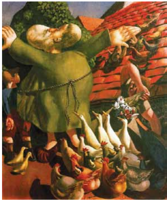
Painting: "Saint Francis and his birds" by Artist: Stanley Spencer