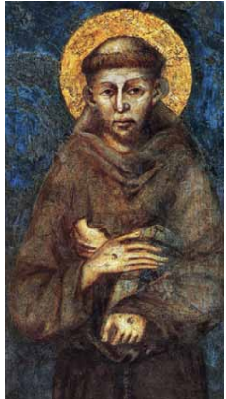
Painting: “Saint Francis of Assisi” by Artist: Cimabue