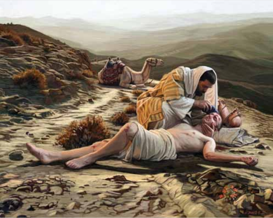
Painting: "The Good Samaritan" 1874 by Artist Vasily Surikov

തികഞ്ഞ നിശബ്ദതയിൽ, ആരാലും ശ്രദ്ധിക്കപ്പെടാതെ, ഒരു മാധ്യമത്തിലും നിറഞ്ഞു നിൽക്കാതെ നിത്യമായ