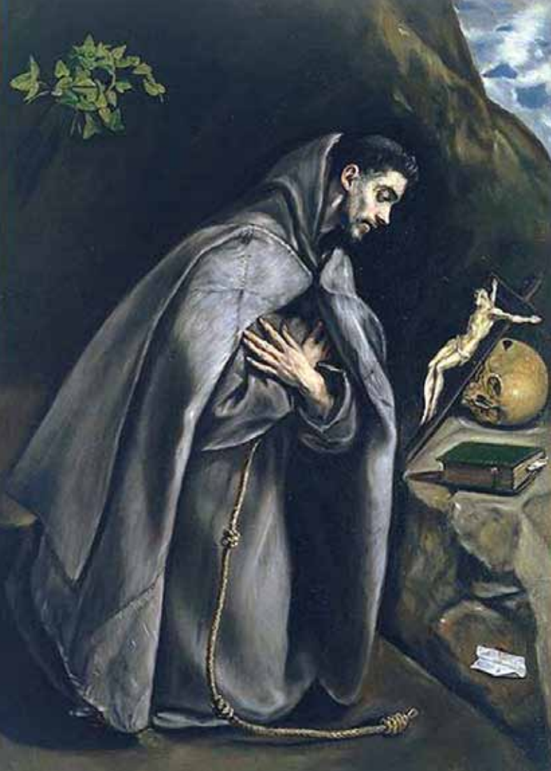
Painting: "St. Francis praying" 1595 by Artist El Greco