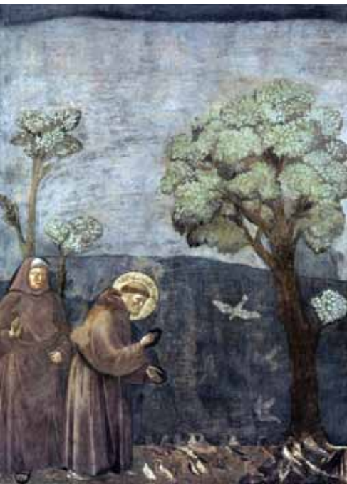
Painting: "St. Francis Preaching to the Birds" 1297-1299 by Artist Giotto

ഫ്രാൻസിസിനെ കുറിച്ചുള്ള നോവൽ എഴുതിക്കൊണ്ടിരുന്നപ്പോൾ സ്നേഹവും ഭക്തിയും ആരാധനയും കൊണ്ട് തന്റെ മനസ്സു നിറഞ്ഞുകുവിഞ്ഞെന്ന് കസൻദ്രസാക്കിസിന്റെ സാക്ഷ്യമുണ്ട്. ഫ്രാൻസിസ് ഒരു പുണ്യവാളൻ മാത്രല്ല, നന്മ നിറഞ്ഞ ഒരു ജീവിത രീതികുടിയാണ്. അത്രത്തോളം എത്തുവാൻ ഒരുപക്ഷേ നമുക്ക് കഴിഞ്ഞെന്നു വരില്ല. പക്ഷേ, ആ തണലിൽ ഇത്തിരി നേരം വിശ്രമിക്കാനെങ്കിലും നമുക്കാവണം ■