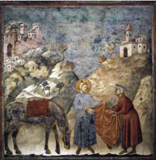
Painting: "St. Francis Giving his Mantle to a Poor Man" 1297-1299 by Artist Giotto

ലോകം ഇന്ന് നേരിടുന്ന വെല്ലുവിളികളെ സ്വജീവിതത്തിലൂടെയും പ്രഘോഷണങ്ങളിലൂടെയും, നേരിടുന്ന വ്യക്തിയാണ് ഫ്രാൻസിസ് പാപ്പ. ജീവനേതിരെയും സമാധാനത്തിനേതിരെയും ലോകമെമ്പാടുമുള്ള തെറ്റായ പ്രവണതകളെ ശക്തമായി അദ്ദേഹം എതിർക്കുന്നു. സഭയ്ക്കുള്ളിൽ കാലാകാലങ്ങളിൽ കുമിഞ്ഞുകൂടുന്ന മാലിന്യക്കുമ്പാരങ്ങളെ തുടച്ചു നീക്കി യേശുവിഭാവനം ചെയ്യുന്ന നവമായ വ്യവസ്ഥിതി പുതിയ ആകാശവും പുതിയ ഭൂമിയും സംജാതമാക്കാൻ ഫ്രാൻസിസ് പാപ്പ പ്രതിജ്ഞാബദ്ധനാണ്. മതസൗഹാർദത്തിന്റെയും, ശാന്തിയുടെയും, സത്യത്തിന്റെയും, നീതിയുടെയും, പുതുയുഗ പിറവിയ്ക്ക് മാർപാപ്പയേക്കാൾപ്പോലും നമുക്കും പ്രാർഥിക്കാൻ സഹകരിക്കാം ■