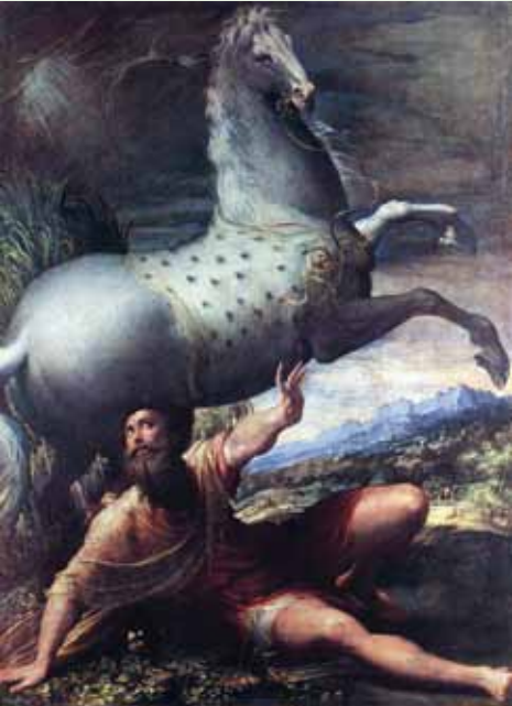
The conversion of St. Paul-1527 by artist Parmigianino

തി രുവനന്തപുരത്തിനും കാസർകോടിനും ഇടയ്ക്കുള്ള ഇരുപത് വ്യത്യസ്ത സ്ഥലങ്ങളിൽ ഏതാനും മാസങ്ങൾ വീതം താൻ താമസിച്ചു. അവിടങ്ങളിൽ സുവിശേഷം പ്രസംഗിച്ച ആളുകളെ മാനസാന്തരപ്പെടുത്തി, അവിടങ്ങളിൽ ക്രൈസ്തവ സഭകൾ സ്ഥാപിക്കുകയും ചെയ്തു. എന്നവകാശപ്പെട്ടുകൊണ്ട് ഒരാൾ ഒരു പുസ്തകം എഴുതി എന്നു കരുതുക. ഇയാൾ എഴുതിയത് സത്യമാണോ അല്ലയോ എന്ന് ആളുകൾക്ക് പെട്ടെന്ന് പരിശോധിച്ചറിയാനാകും. കാരണം, ഇയാൾ എഴുതിയത് സത്യമാണെങ്കിൽ പുസ്തകം പ്രസിദ്ധപ്പെടുത്തിയതിനു ശേഷമുള്ള വർഷങ്ങളിൽ മേൽപറഞ്ഞ സ്ഥലങ്ങളിൽ ഇയാളാൽ മാനസാന്തരപ്പെടുത്തപ്പെട്ട മനുഷ്യരും ഇയാളാൽ സ്ഥാപിക്കപ്പെട്ട സഭകളും കാണപ്പെടും. ഇയാൾ പറഞ്ഞത് നുണയാണെങ്കിൽ നൂറു വർഷത്തിനുള്ളിലെങ്കിലും ഇയാളുടെ പുസ്തകത്തിന് വ്യാപകമായ അംഗീകാരം കിട്ടാൻ പോകുന്നില്ല.